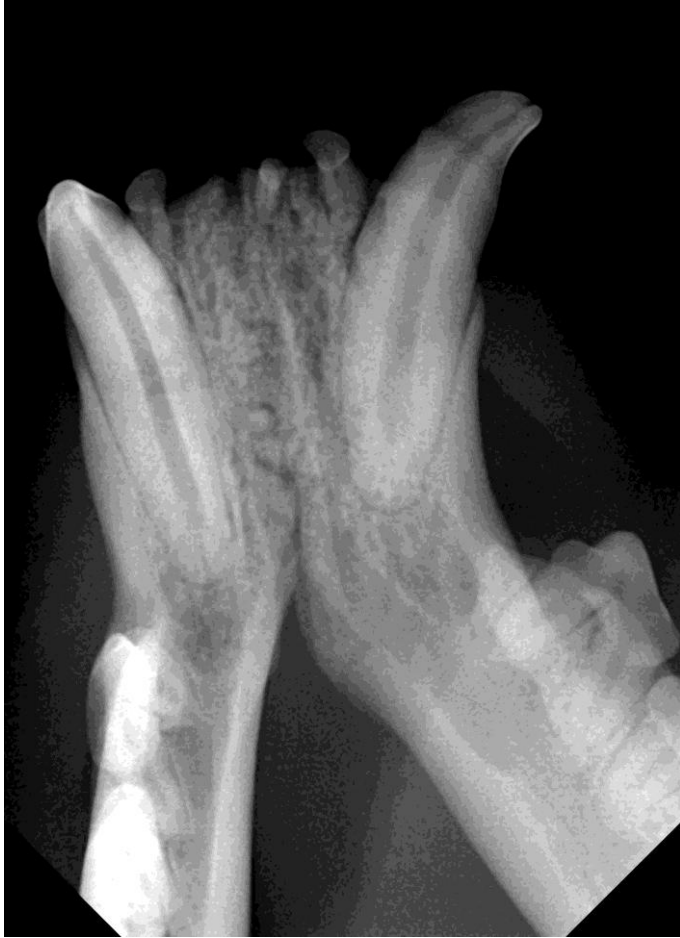
3. kat YY onderkaak. Kronen naar boven gericht.