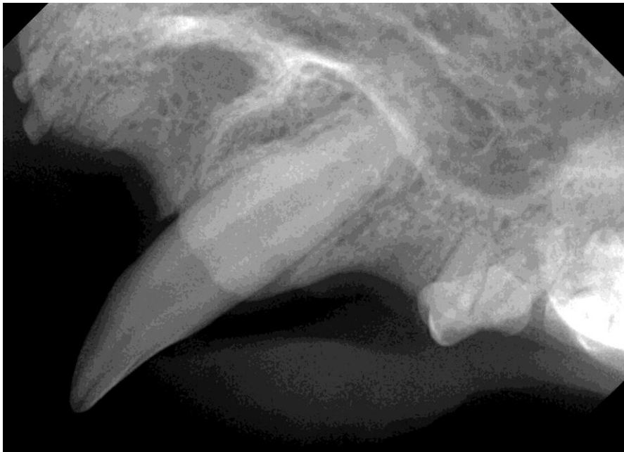
4. kat YY: röntgenfoto 204.