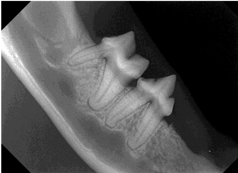
1. kat YY: rechter mandibula. Kronen naar boven gericht.

Voorbeeld juiste wijze aanleveren röntgenfoto kat en hond. De aanduiding (markeerteken) links/rechts is vanwege bewerking verdwenen. Let erop dat die aanwezig moet zijn (bij sommige digitale programma's staat deze er niet op) en laat de stip ook altijd op dezelfde locatie in de mondholte. Het markeerteken is standaard altijd aan de craniale zijde van de foto.