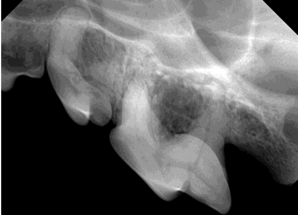
5. hond XX : röntgenfoto 207 en 208. Ook hier kronen naar beneden gericht.